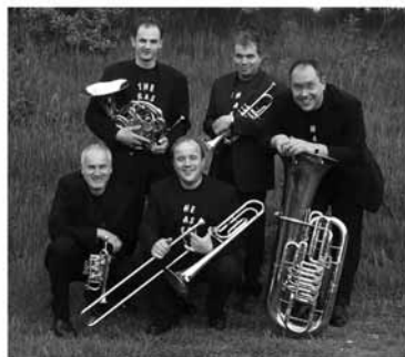
Das Ensemble spielt zu Gunsten der Renovierung der Pfarrorgel.