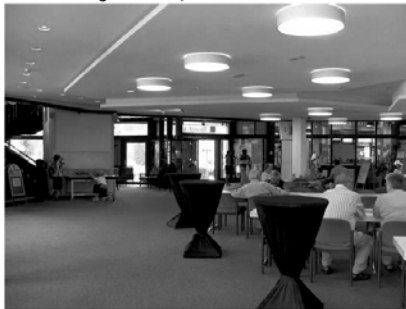
Freundliche Atmosphäre im neugestalteten Foyer.