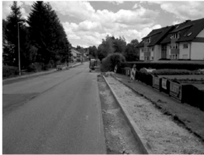
Erneuerung des talseitigen Gehweges mit Bordsteinen und Asphaltdecke.