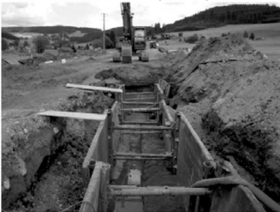
Verlegung der Abwasser- und Wasserleitungen sowie des DSL-Leerrohrs im Langenordnachtal.