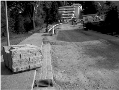
Fertigstellungsarbeiten des Gehweges und der Straße bis Ende August 2011.